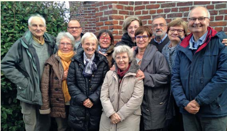
L'équipe de la permanence Ecoute