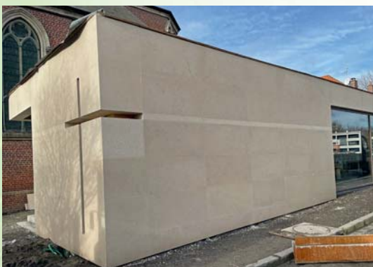
Avancement des travaux du magasin